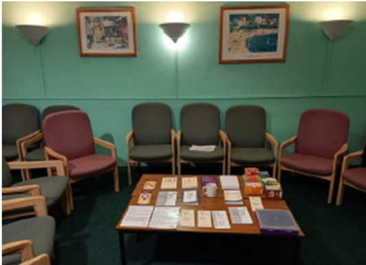
Arriba: Exeter, Inglaterra Reino Unido 7:30 en la noche del lunes