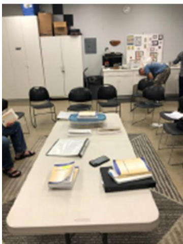
Arriba: Thousand Oaks, California USA jueves en la noche