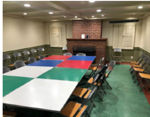
Abajo: Grants Pass, Oregon USA jueves por la noche